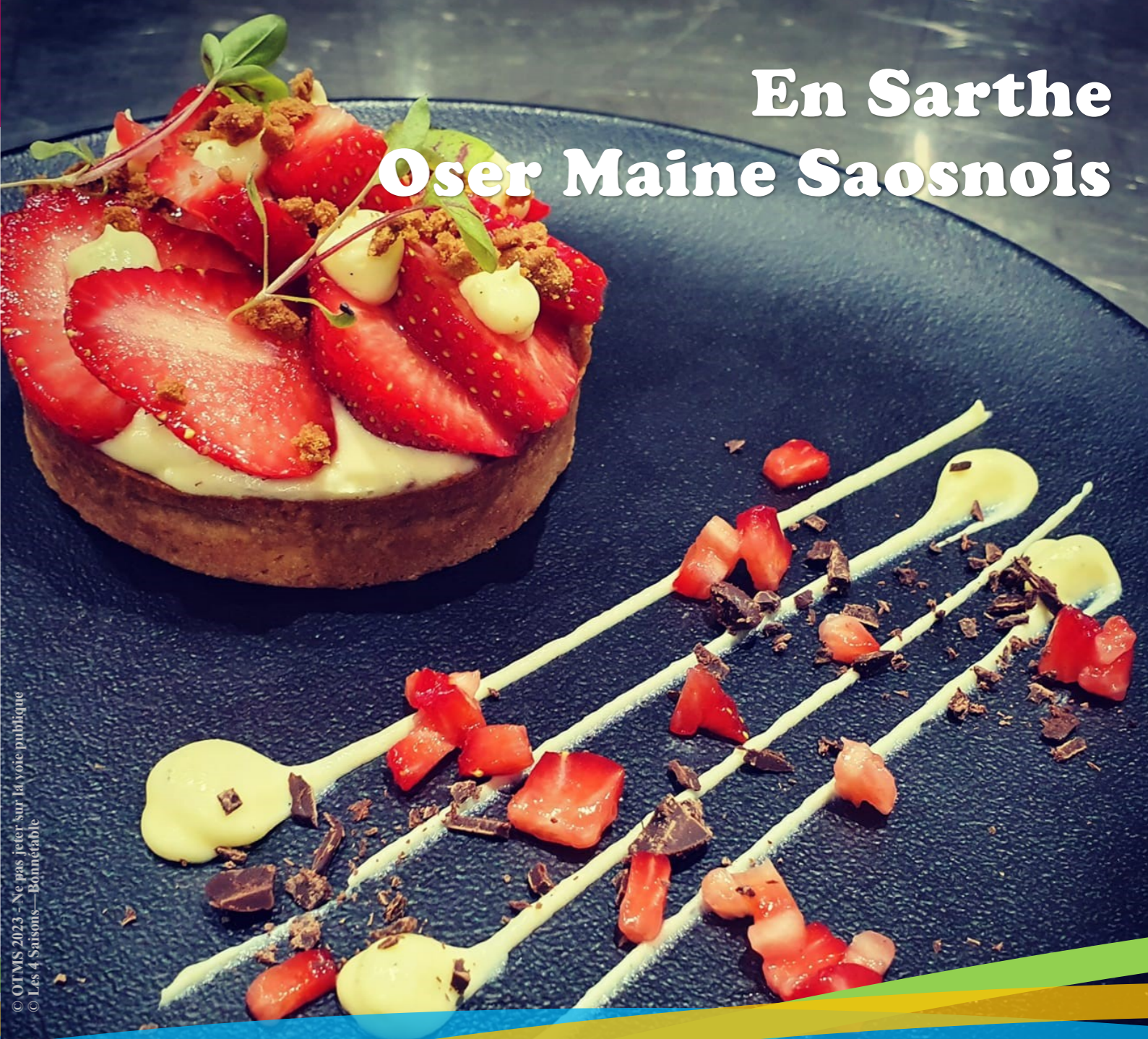
© OTMS 2023 - Ne pas jeter sur la voie publique © Les 4 Saisons - Bonnétable